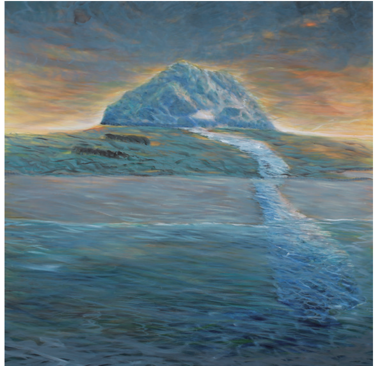
CHRISTIAN ZILLNER D-Day, 2015, 170 × 170 cm, olaj, vászon

Mégis ismerősnek tűnnek ezek a jelenetsorok. Némely kép esetében szinte meg sem lepődnénk, ha a következő pillanatban egy méretes Pán kanyarodna be a sarkon, hogy a látóterünkbe, azaz a képmezőbe lépjen. Avagy az istenség, legyen az bármiféle, már elhagyta a képet? Egy apokaliptisz utáni tájról van szó? Esetleg épp ellenkezőleg, az emberiség teremtése előtti világról? Első pillantásra RÉVÉSZ LÁSZLÓ LÁSZLÓ képei is ismerősek: bár látszólag „grafikusak” alakjai – régmúlt hősökre való emlékezések (a Graphic Novel-re vagy