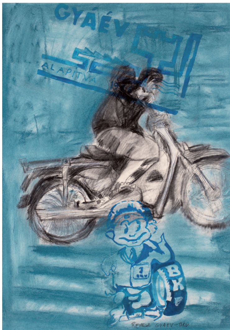
RÉVÉSZ LÁSZLÓ LÁSZLÓ BKV, 2016, ceruza, pasztell, papír, 100 × 70 cm