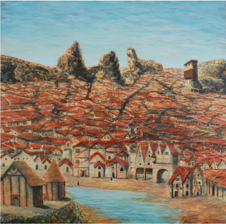
CHRISTIAN ZILLNER Ghetto, 2015, 170 × 170 cm, olaj, vászon