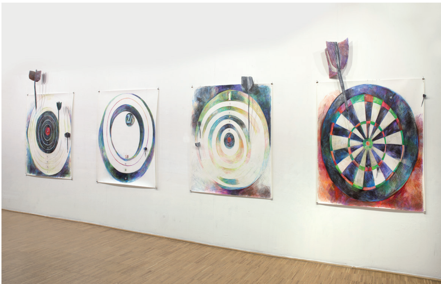
DORSÁNSZKI ADRIENN G, 2016, vegyes technika, 150 x 150 cm egyenként